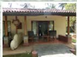
ゆったりとしたテラス