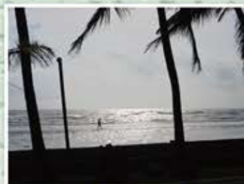
宿泊先の前はキレイな海