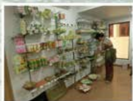
アーユルヴェーダストアも充実