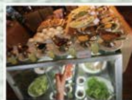
豊富なメニューのビュッフェ