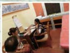
アーユルヴェーダ問診