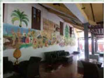
フロントの壁画はアーユルヴェーダ物語