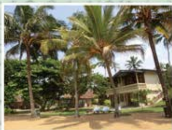
木が生い茂る抜群な環境