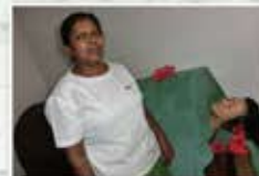
マッサージ後のスチームバス