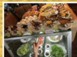
豊富なメニューのビュッフェ