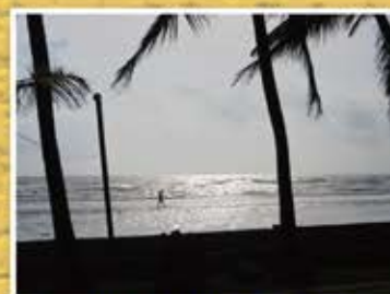
宿泊先の前はキレイな海