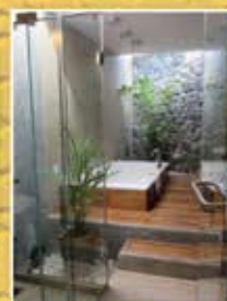
キレイなバスタブ付き風呂

企画・お問い合わせ：株式会社ジャパンヘナ 〒150-0022東京都渋谷区恵比寿南1-21-19 Tel:03-3794-6992(担当 工藤)