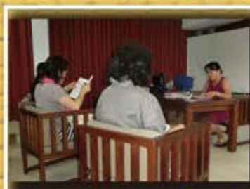
ヘナ&アーユルヴェーダの理論