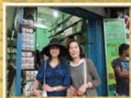
現地ストアでお買物