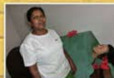
マッサージ後のスチームバス