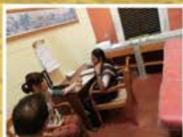
アーユルヴェーダ問診