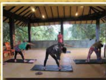
本場講師によるヨガ体験