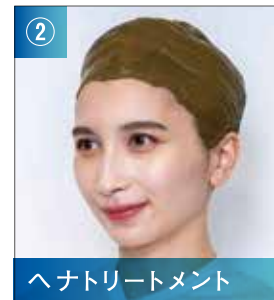
ヘナトリートメント