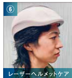
レーザーヘルメットケア