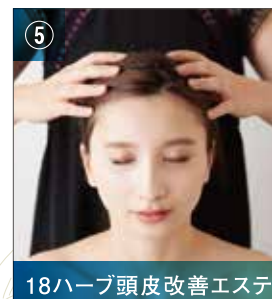
18ハーブ頭皮改善エステ